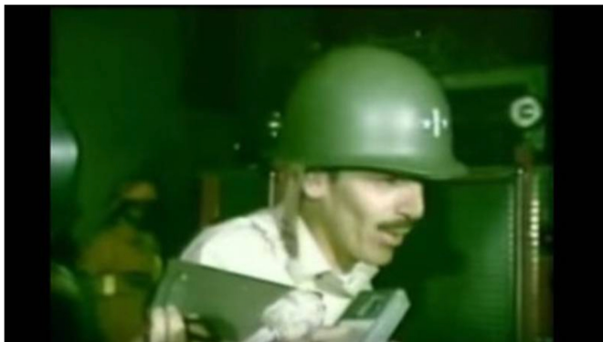
Captura de pantalla

Está acusado por ejecución extrajudicial y tortura en hechos del Palacio de Justicia en ese país.