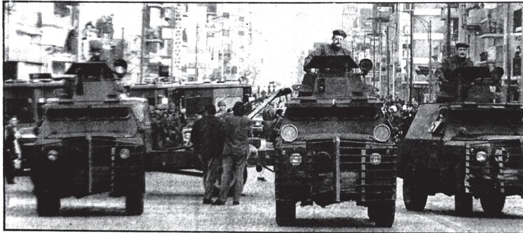
Las unidades antiguerrilleras de la Policía Federal. Varias de ellas se hallaban frente a la sede justicialista en el momento de proceder al retiro de los féretros.