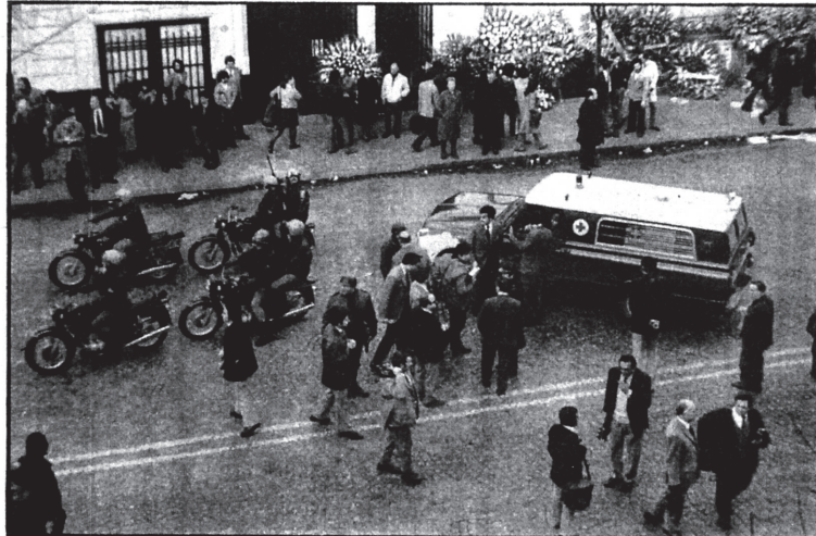
Motos, ambulancias y armas de todo calibre, frente a la sede justicialista. A muchos ojos —totalmente objetivos— les pareció ver un poco de exageración en el despliegue policial.